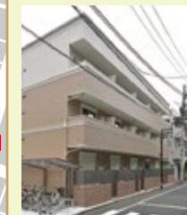
※今回見学頂ける会場の 外観写真です。