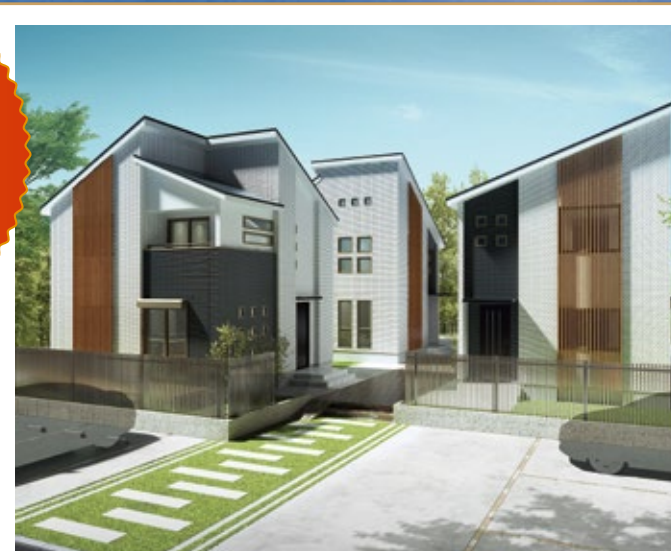
※掲載の画像はイメージです。一部仕様が異なる場合があります。 ※1:賃料は、横浜市営地下鉄ブルーライン「センター北駅」徒歩10分に上記プランを建てた場合(平成29年8月時点)の想定です。(その賃料が確実に得られることを保証するものではありません)。又、公租公課その他当該物件を維持するために必要な費用の控除前のものです。表示の利回りは、1年間の予定賃料収入の取得対価に対する割合です。

参考 横浜市営地下鉄ブルーライン 「センター北駅」徒歩10分 月額賃料: 20.5万円 年間賃料: 246万円 ↓ 表面利回り(税別)*1 16.4%!!