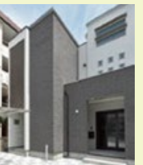
※今回見学頂ける会場の 外観写真です。