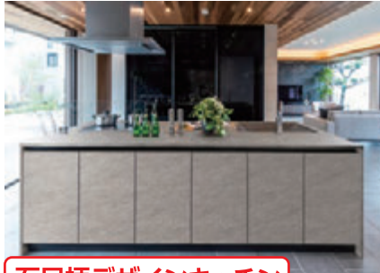
石目柄デザインキッチン