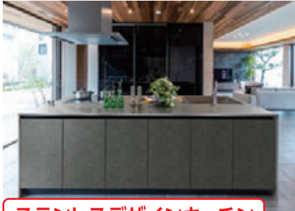
ステンレスデザインキッチン