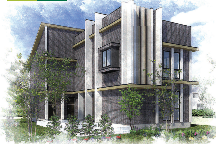
※掲載のペースはイメージです。一部仕様が異なる場合があります。

モニターハウスとは建築中や完成後に見学会場としてお借りしたり、アンケートにお答えいただくことが可能で、立地・建物規模・お借りする時期・期間等の条件が弊社基準を満たしている住宅を指します。完成後2カ月間、1室を案内用として利用させていただくことがキャンペーンの条件となります。※条件等によりモニターハウスとしてお借りできない場合がございます。