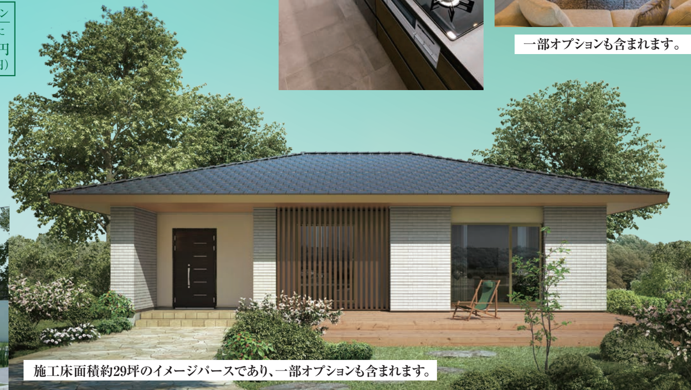
施工床面積約29坪のイメージパースであり、一部オプションも含まれます。