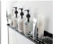
マグネットバスルームラック ロング