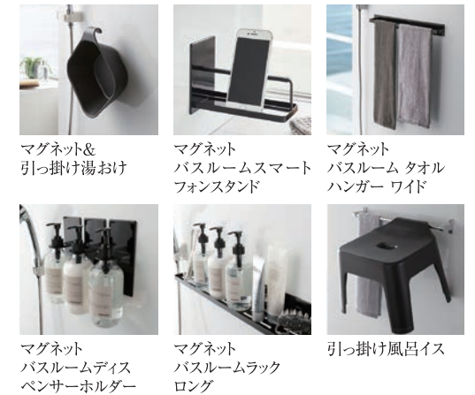
マグネット&引っ掛け湯おけ