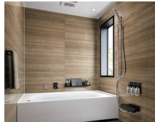
カラーバリエーション：ブラック/ホワイト

Simple × Assemble × Beauty tower × 住友不動産 一信用と創造