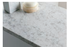
クォーツストーンカウンター