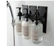
マグネットバスルームディスプレイペンサードホルダー