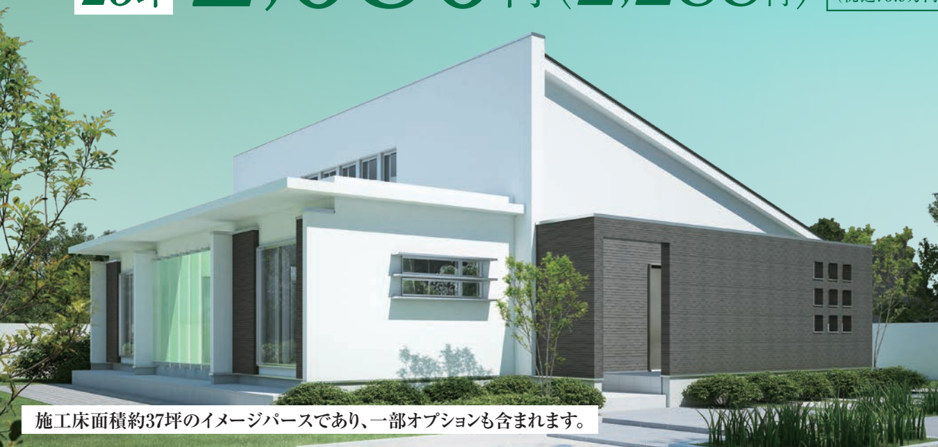
施工床面積約37坪のイメージパースであり、一部オプションも含まれます。