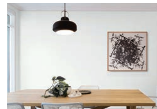
※「抗ウイルス壁紙」の詳細については「リリカラ」ホームページをご参照ください。

壁紙に付着した特定のウイルスが減少。抗菌効果もあるので、より衛生的。日常のメンテナンス（拭取り）でも効果が持続します。