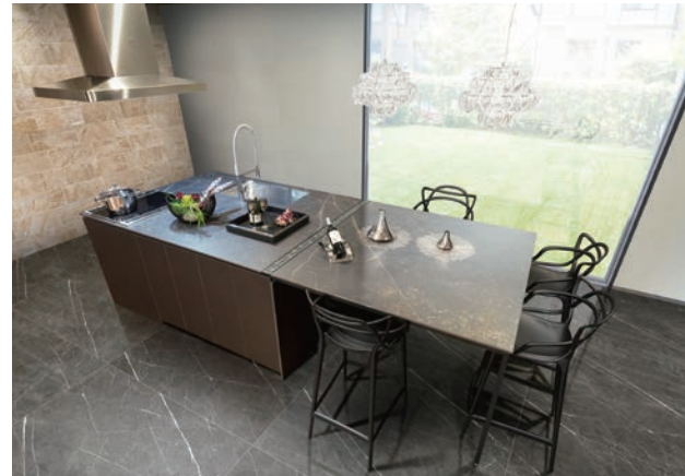
※一部オプションが含まれます。

スクエア型 人が集う。笑顔が生まれる。楽しいひと時を多くの方と分かちあうスクエアタイプ。