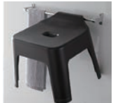
引っ掛け風呂イス