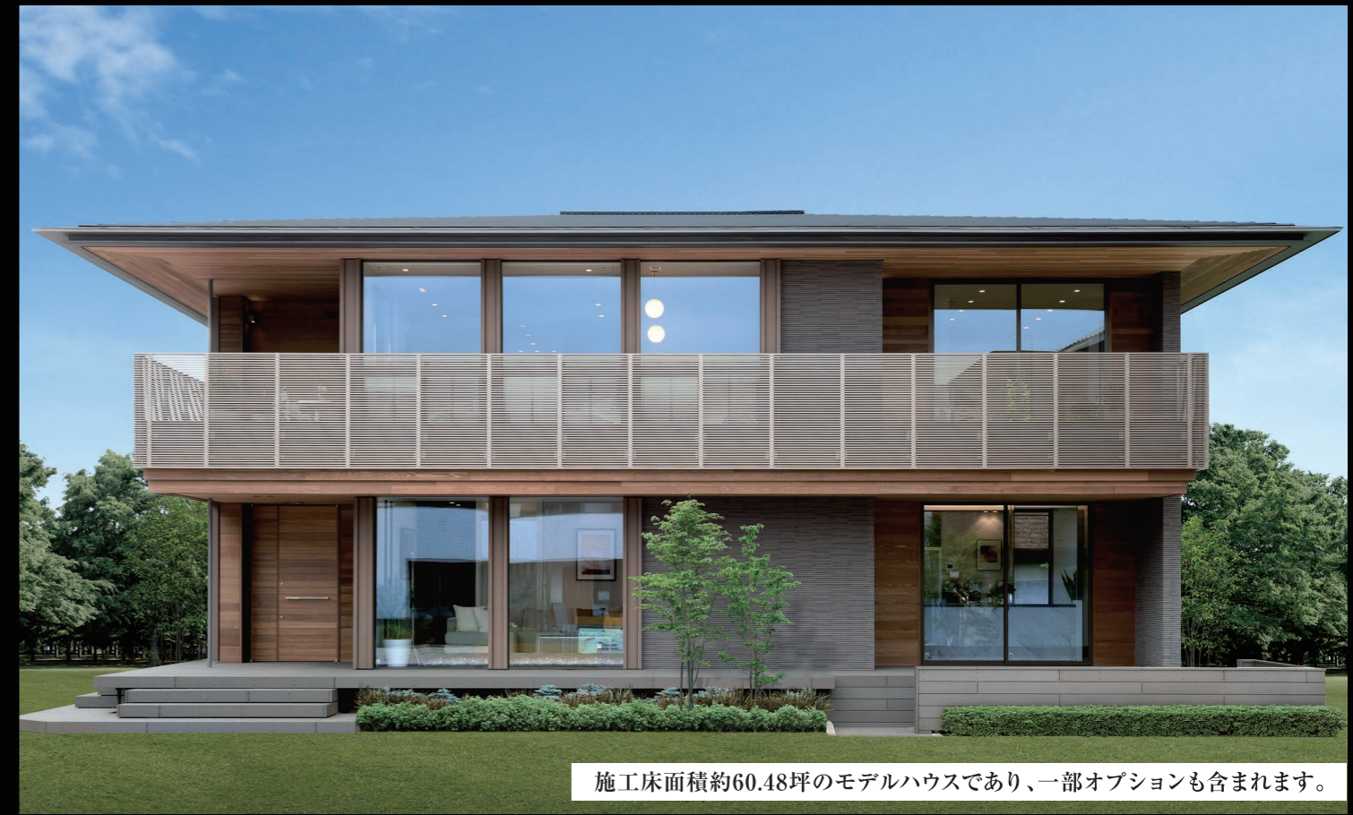
施工床面積約60.48坪のモデルハウスであり、一部オプションも含まれます。