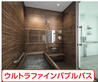
ウルトラファインバブルバス

同ビル5階住友不動産ハウジングプラザでもオリジナル設備を展示 住友不動産ハウジングプラザ 事前予約制