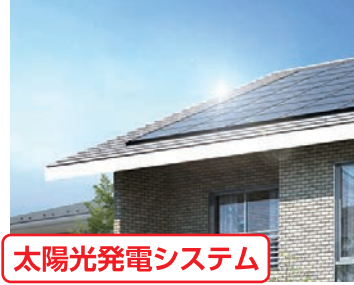
太陽光発電システム