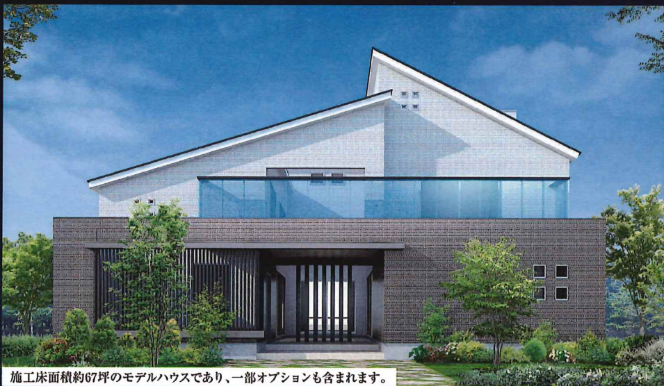
施工床面積約67坪のモデルハウスであり、一部オプションも含まれます。

2022年11月30日(水)迄にご契約、2023年3月31日(金)迄に着工、 2023年7月31日(月)迄にお引渡し可能な方