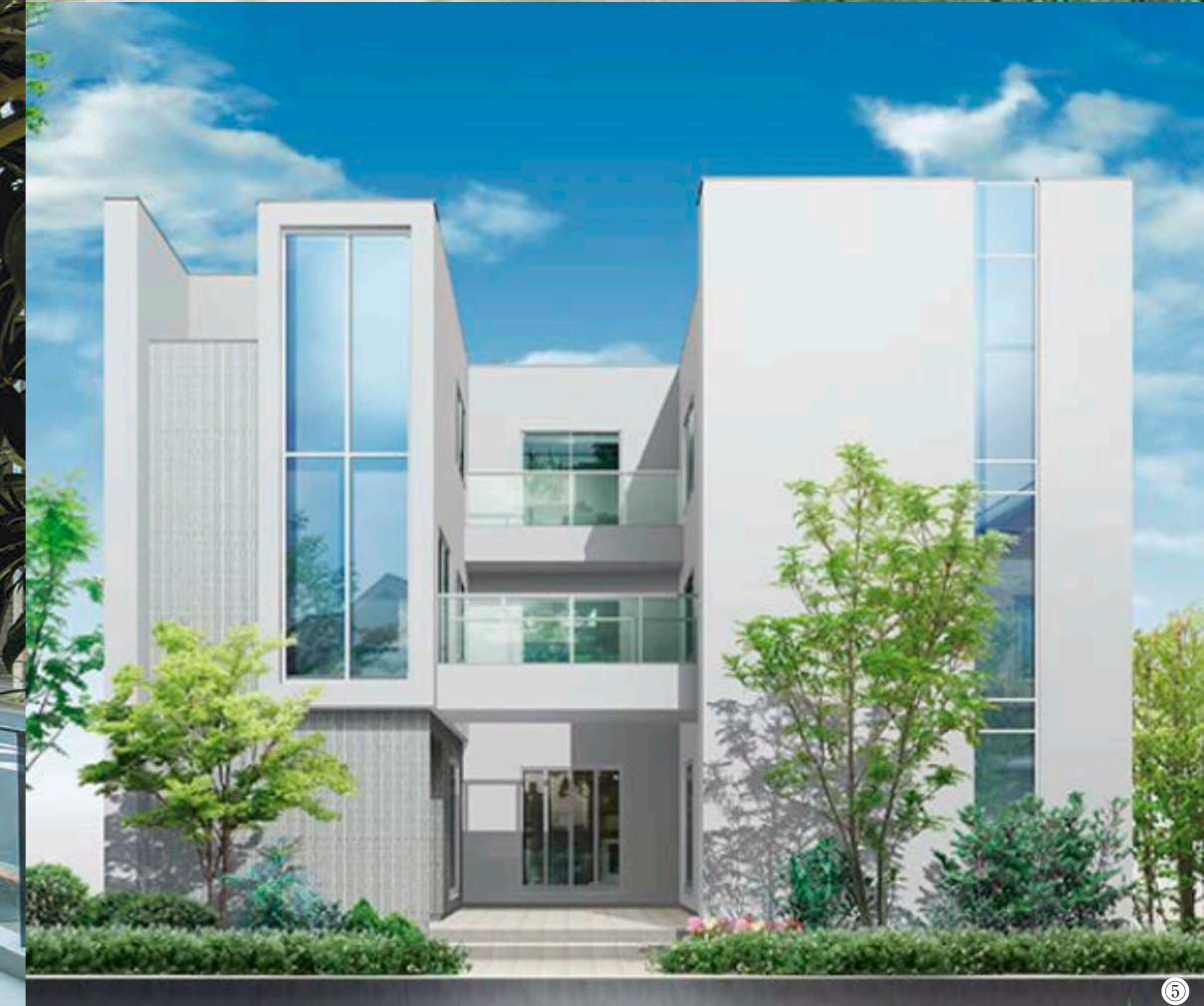
①施工床面積約60.48坪の当社施工例です。②施工床面積約88坪の当社施工例です。③施工床面積約47坪の当社施工例です。④施工床面積約43.33坪の当社施工例です。⑤施工床面積約73.20坪の当社施工例です。写真はイメージです。一部オプションが含まれます。