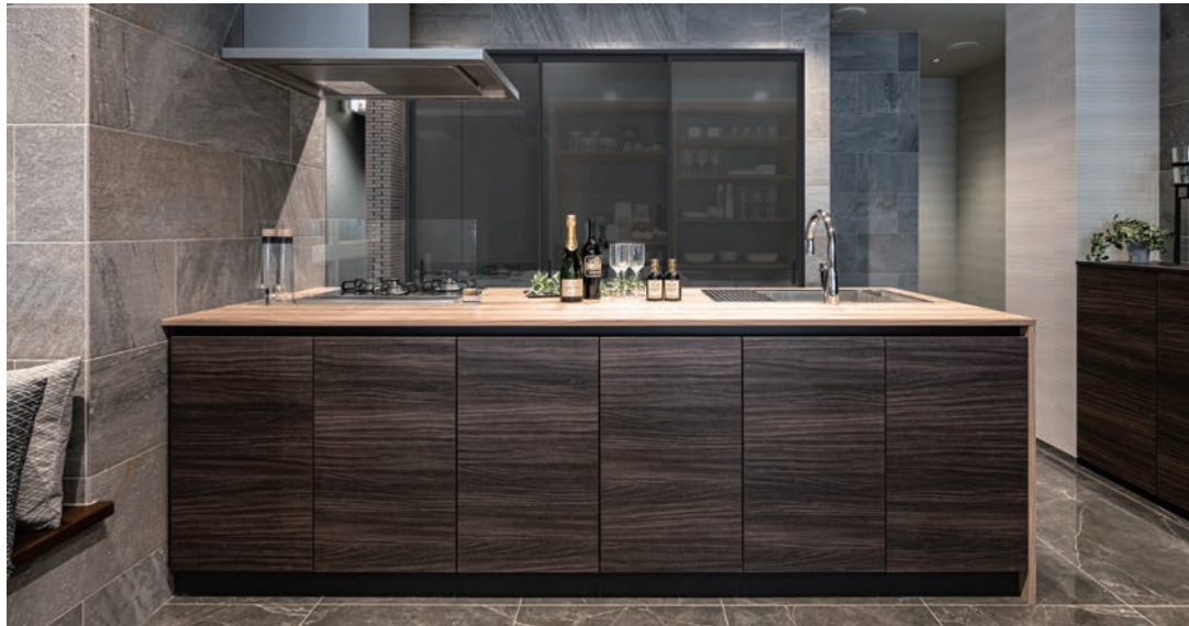
カウンターカラーバリエーション