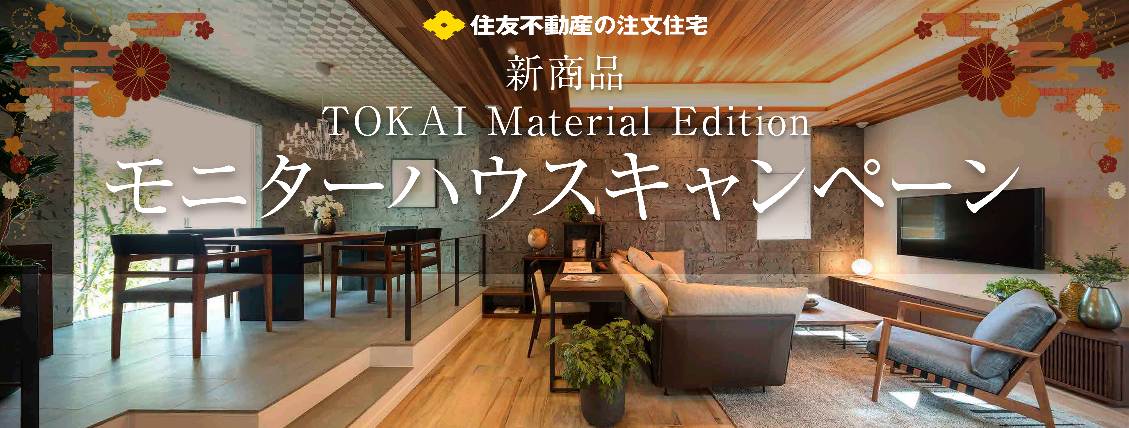
※写真はイメージです。一部オプションが含まれます。