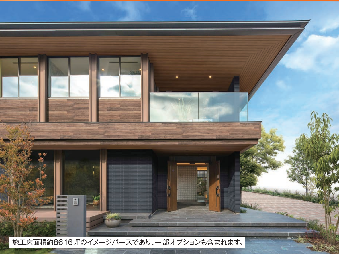
施工床面積約86.16坪のイメージパースであり、一部オプションも含まれます。