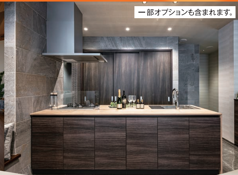
一部オプションも含まれます。