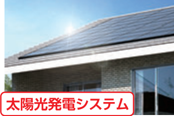
太陽光発電システム