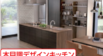
木目調デザインキッチン