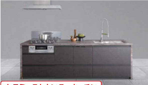
セラミックカウンターキッチン