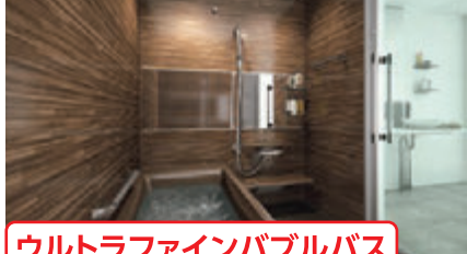
ウルトラファインバブルバス

住友不動産の高断熱・省エネルギー・創エネルギー ZEH仕様、高品質な住まいをご紹介します!