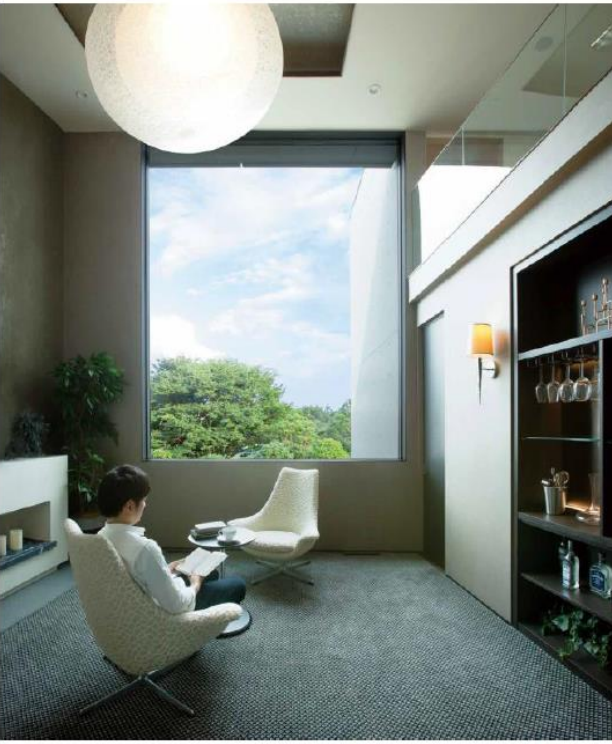
大きな窓の吹き抜け

都市型住宅では隣地との間隔が狭く、道路からの距離も短いという環境も多く、いかに開放的で住み心地の良い空間を作り出せるかが求められます。この住宅は、開口部の位置を工夫し、外部からの視線を徹底的にコントロールすることによって、都心部であっても窓を大きく設け、光や緑を多く取り込みながら目線を制御できる開放的な空間を提案しています。