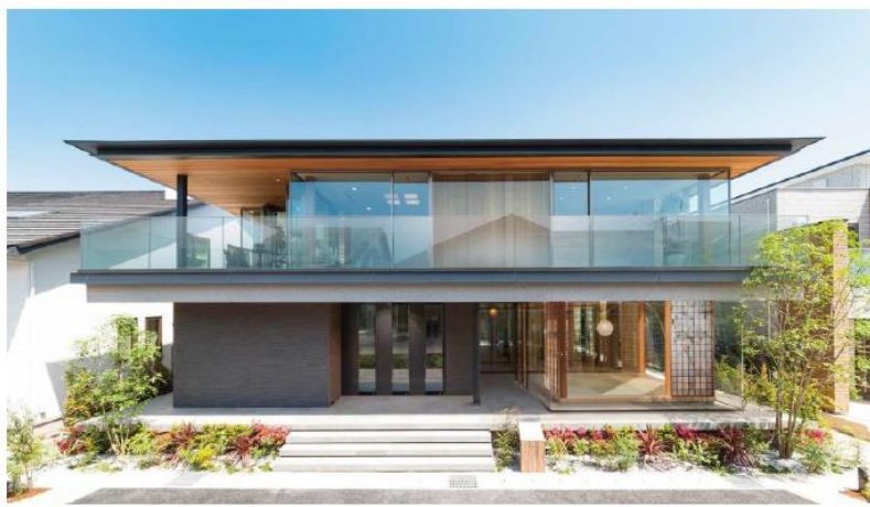
前橋みなみモデルハウス／外観

この住宅は、これまで独立したプライベート空間として敷地の奥に配置しがちだった「離れ」をあえて表へ出し、母屋との間に生まれた路地空間ごと街にあずけることで、近隣住民とのコミュニケーションの場を作り出すなど、街と一体化する新しいスタイルを提案しています。