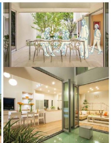
共通リビングとして使用できる半外空間