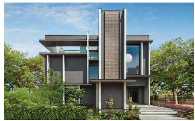
横浜第一モデルハウス／外観

都市型住宅では隣地との間隔が狭く、道路からの距離も短いという環境も多く、いかに開放的で住み心地の良い空間を作り出せるかが求められます。この住宅は、開口部の位置を工夫し、外部からの視線を徹底的にコントロールすることによって、都心部であっても窓を大きく設け、光や緑を多く取り込みながら目線を制御できる開放的な空間を提案しています。