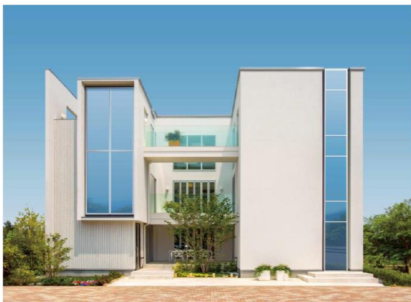
赤羽モデルハウス／外観

これまで2世帯住宅といえば、親世代が1階に、子世代が2階となる場合が一般的で、生活リズムの違いから、生活音問題が課題のひとつとされてきました。この住宅は、その概念を大きく変え、それぞれの生活スペースを「縦割り」にして分けることで、音の問題を含め、お互いのプライバシーを守り、程良い距離感を確保する空間を提案しました。