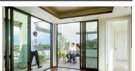
インナーバルコニー

壁とガラスの組み合わせを工夫しバルコニーを囲むことで、近隣建物や道路からの見合いを気にすることなくバルコニーを日常的に居室としても使うことが可能になります。