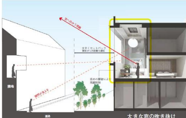
大きな窓の吹き抜け

住人の動線にあたる部分やプライベート空間はしっかりと保護し、逆に2階吹き抜け空間など人が通らない部分には、大型サッシで開口部を最大限に設け、視線の位置をずらすように設計しています。また、開口部の上下部分に庇を設けることで、道路レベルからの視線も遮ることができ、オープンでありながらもストレスを感じることなく心地よい開放空間を作り出しました。